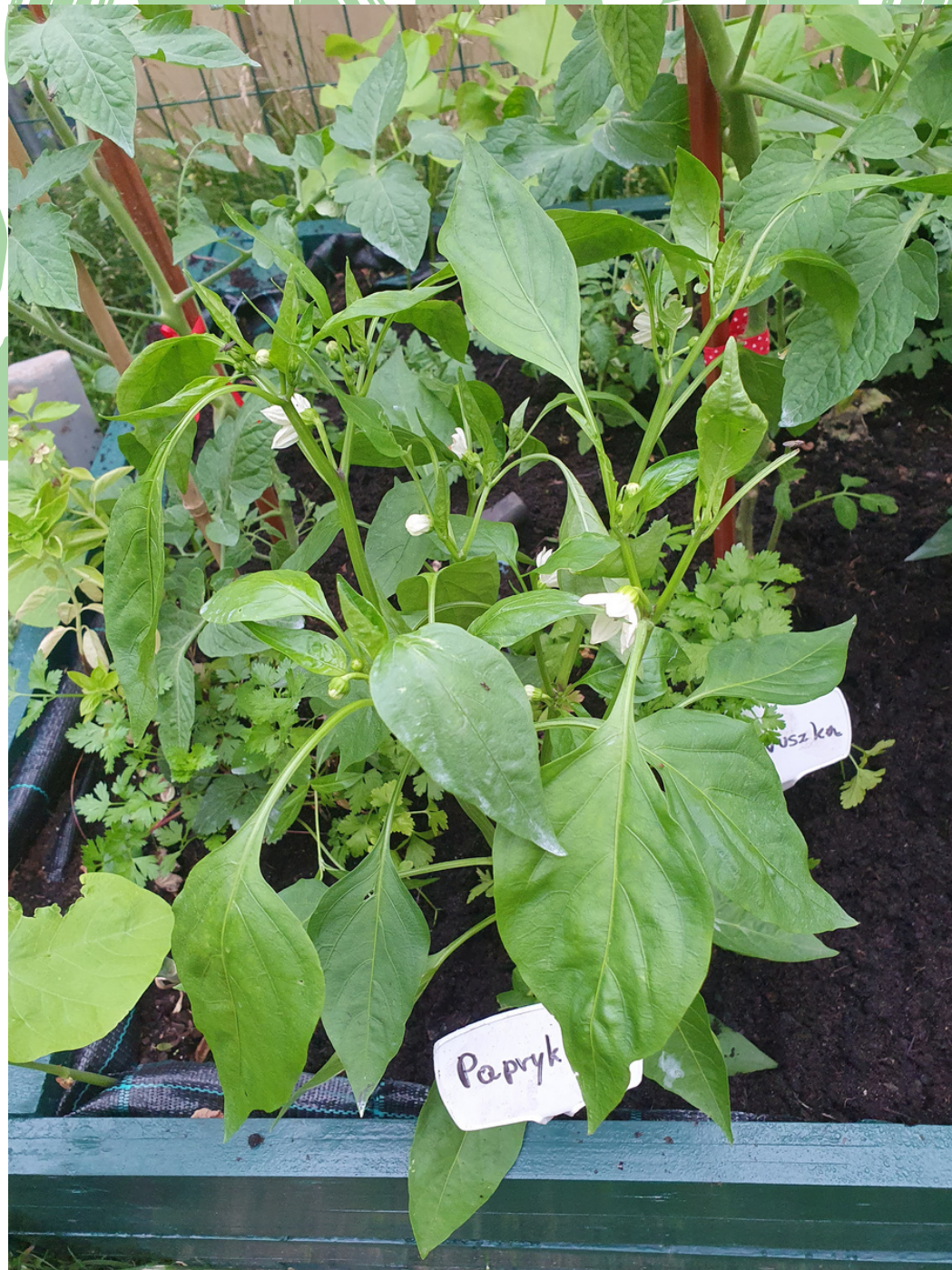
nawożone metodą naturalną