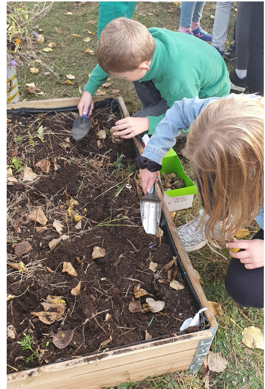
SADZENIE CEBULEK TULIPANÓW