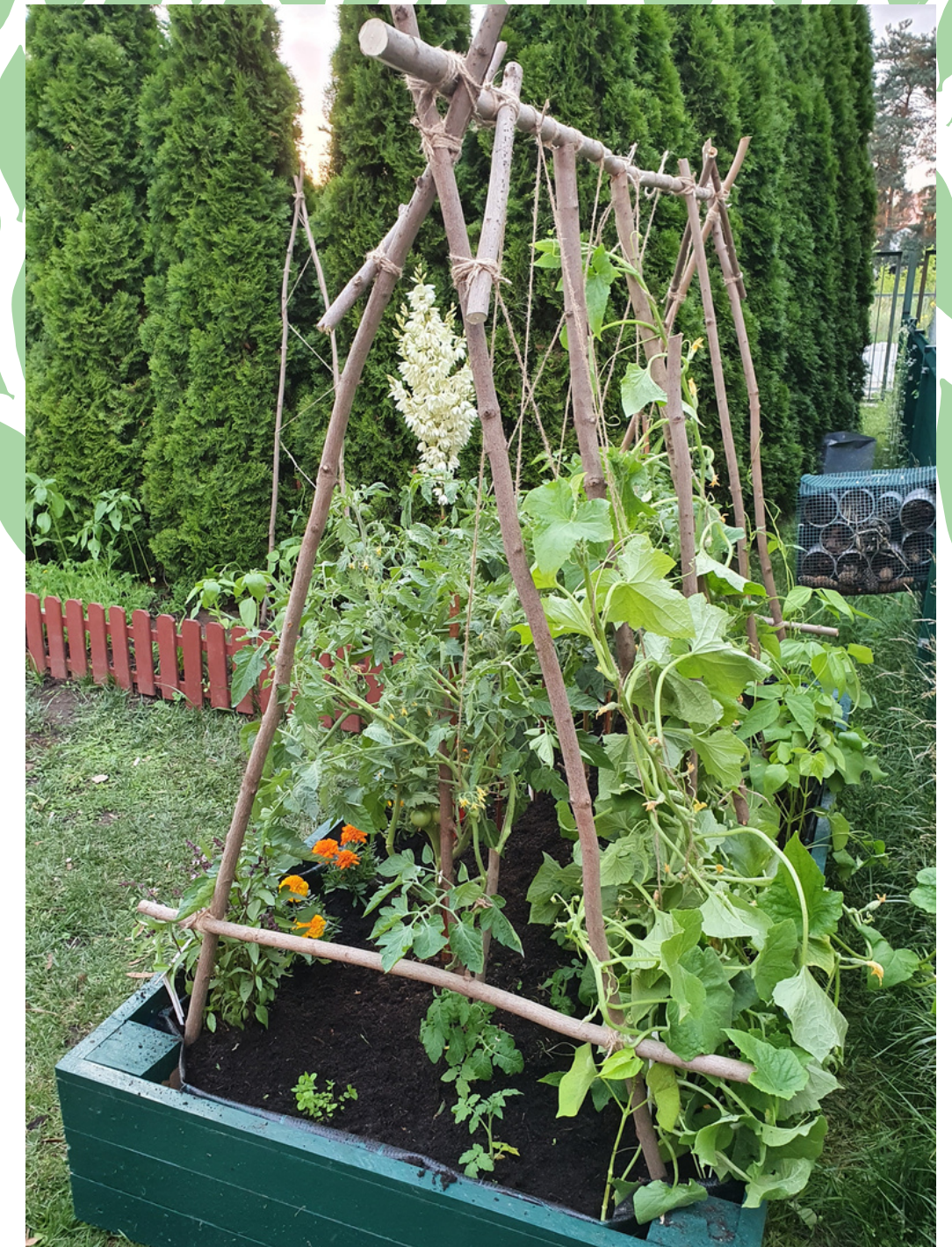
bez użycia chemicznych środków ochrony roślin